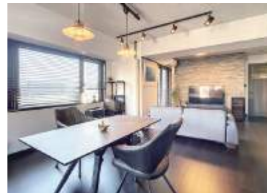
▲週末にショットバーを営まれているご夫婦ならではのセンスが家具や小物選びにも光ります。