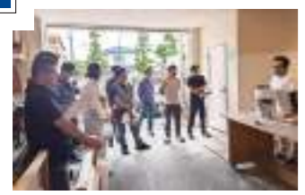
▲社員全員が「キララ」の研修に参加 しました。 キタセツに関わ るすべての方の健康を 願ひ、快適に暮らし 続けられる住まいを ご提供できるよう、 これからも日々勉強 してまいります。

折角なので健康についてのこだわりをも 少しお伝えすると、キタセツは食材だけでな く「水」と「空気」にもこだわっています。 人体の60%は水できています。また人は 一日に約20kgの空気を吸っており飲食物の10 倍と言われています。キタセツが推奨してい る「家中丸ごと塩素を除去した浄水器『アク ウィズ』や「風の出ないエアコン『エフコン』」 また今回しあわせいろで紹介している「体に 安全な天然素材の塗り壁塗料『キララ』」こ れらは全て社内 用し効果も実感 しています。