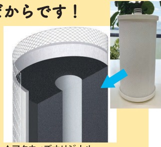
▲アクウィズオリジナル活性炭フィルター

塩素除去率99%以上の高性能フィルター「特殊製法のアクウィズオリジナル活性炭フィルター」を採用しています。 そのことにより、塩素によるまじい味や臭いなくなり、飲みやすいお水に生まれ変わります。